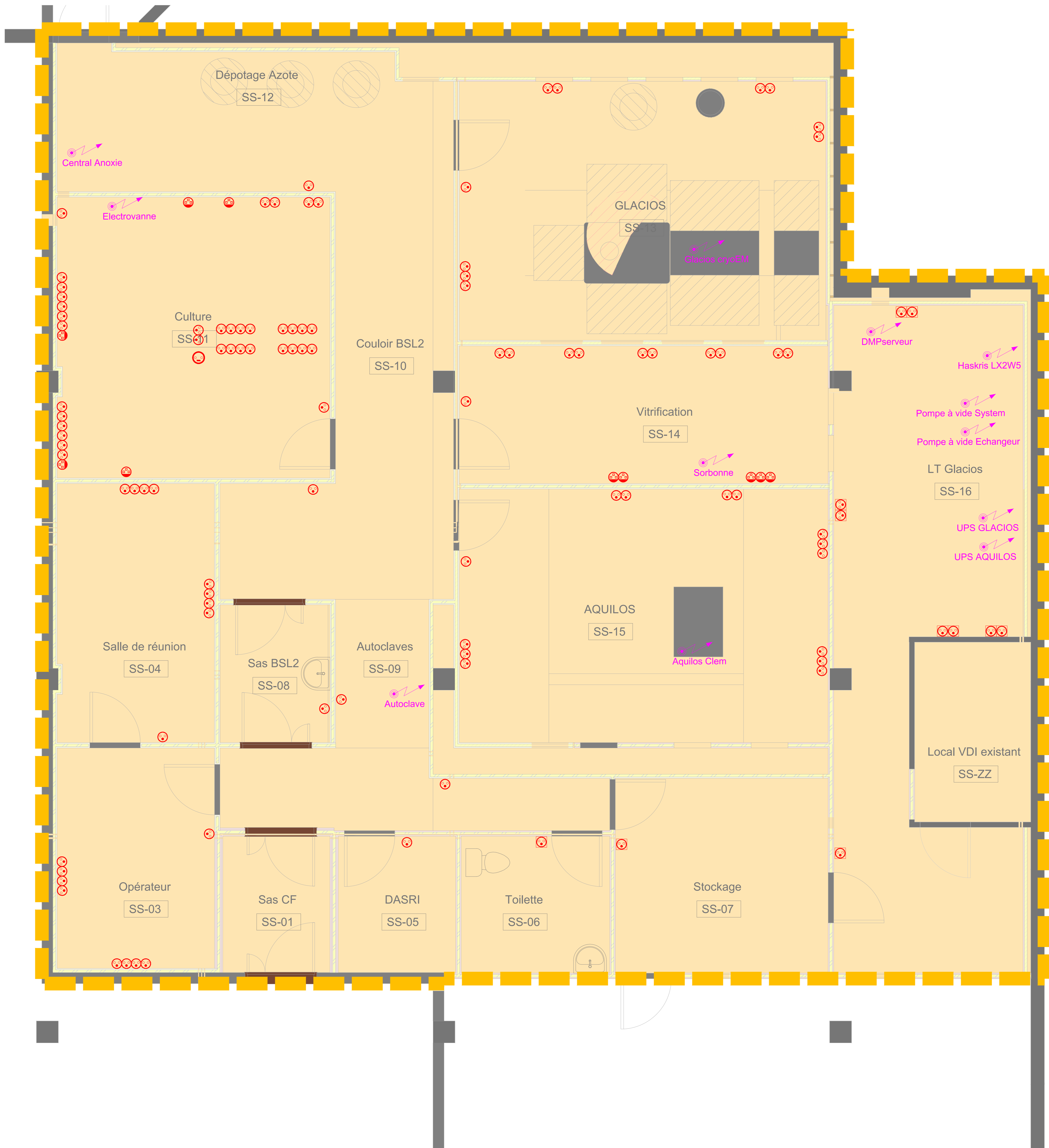
Echelle - 1/30